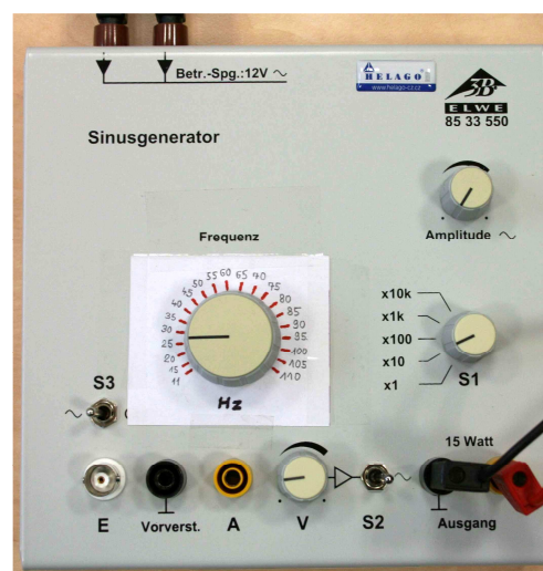
Obr. 3 Generátor s výkonovým zesilovačem