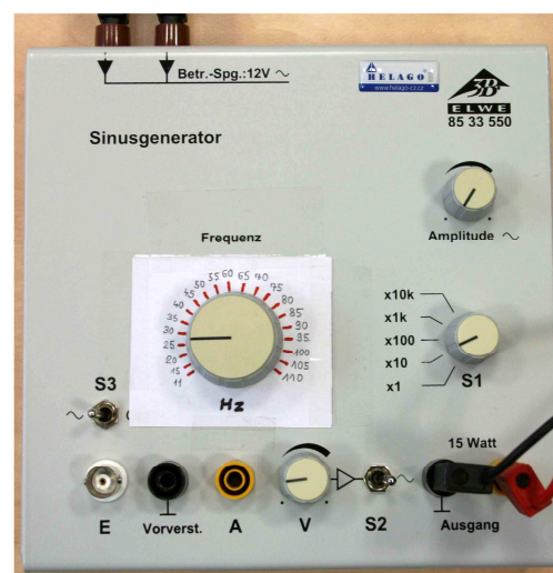
Obr. 3 Generátor s výkonovým zesilovačem